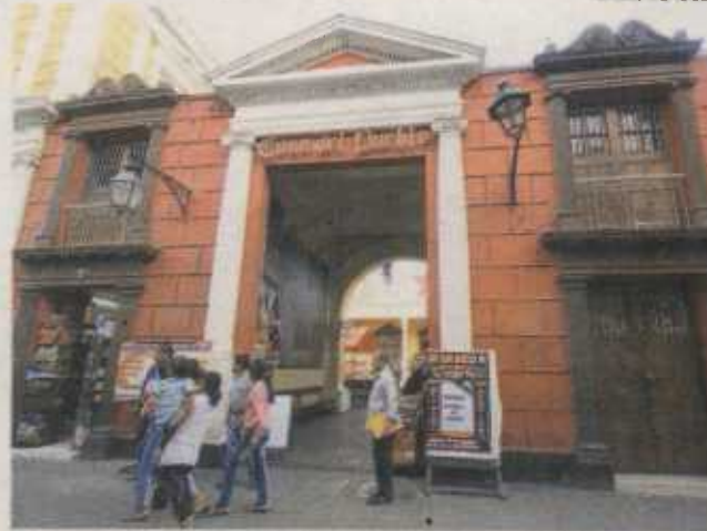
INCERTIDUMBRE. Lucha de facciones afecta a militantes.