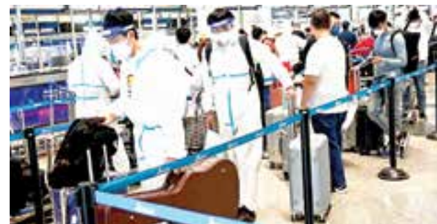
La nueva variante ómicron del coronavirus presenta "un riesgo muy elevado" para el

Lima, 29 de noviembre del 2021 GERENTE GENERAL