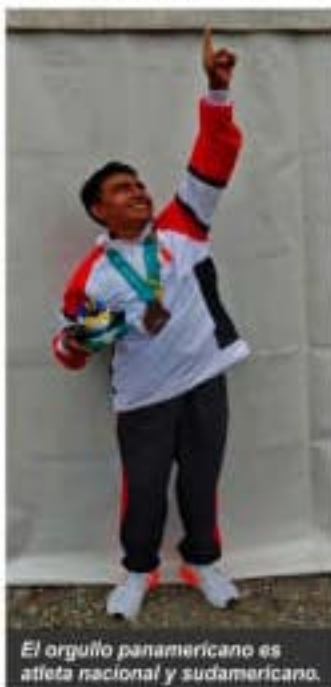
El orgullo panamericano es atleta nacional y sudamericano.

En estos tres últimos días, El Tuco tuvo una espléndida participación, compitiendo con deportistas mundiales que cuentan con todo el apoyo y respaldo de sus autoridades, pero a pesar de ello, superó todos estos obstáculos y hoy nos trae una preciada que retumbará todo el valle del río de Pachachaca, pues es ahí, donde realiza sus entrenamientos.